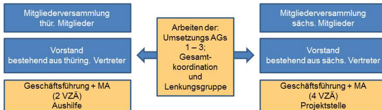
Abbildung 1: Konstellation TVV und TVT bis Ende 2014

Die Konstellation der beiden Verbände bis zur Gründung des gemeinsamen e.V. s 2015 ist wie folgt: